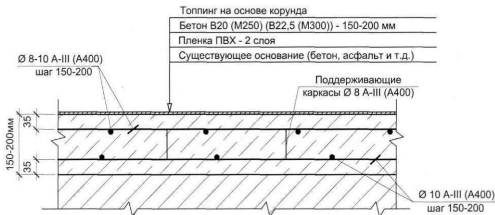
Схема устройства пола

Обращаться по телефонам +7(499) 703 3789, +7(831) 429-03-09